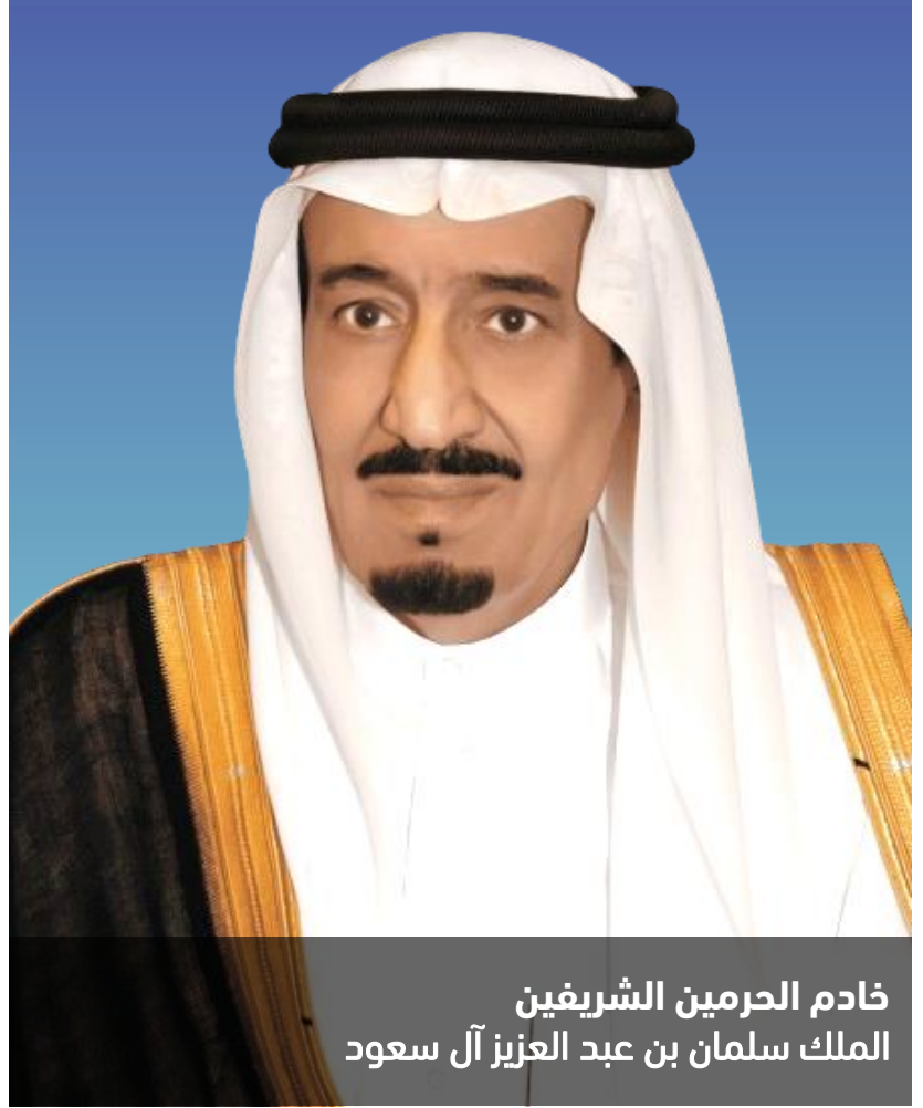
خادم الحرمين الشريفين الملك سلمان بن عبد العزيز آل سعود

” ما يميز هذه البلاد هو حرص قادتها على الخير والتشجيع عليه، وما نراه من مؤسسات خيرية في مختلف المجالات، سواء التي تحمل أسماء ملوك هذه البلاد أو سواها، إلا جانباً واحداً من الجوانب المشرقة لبلادنا