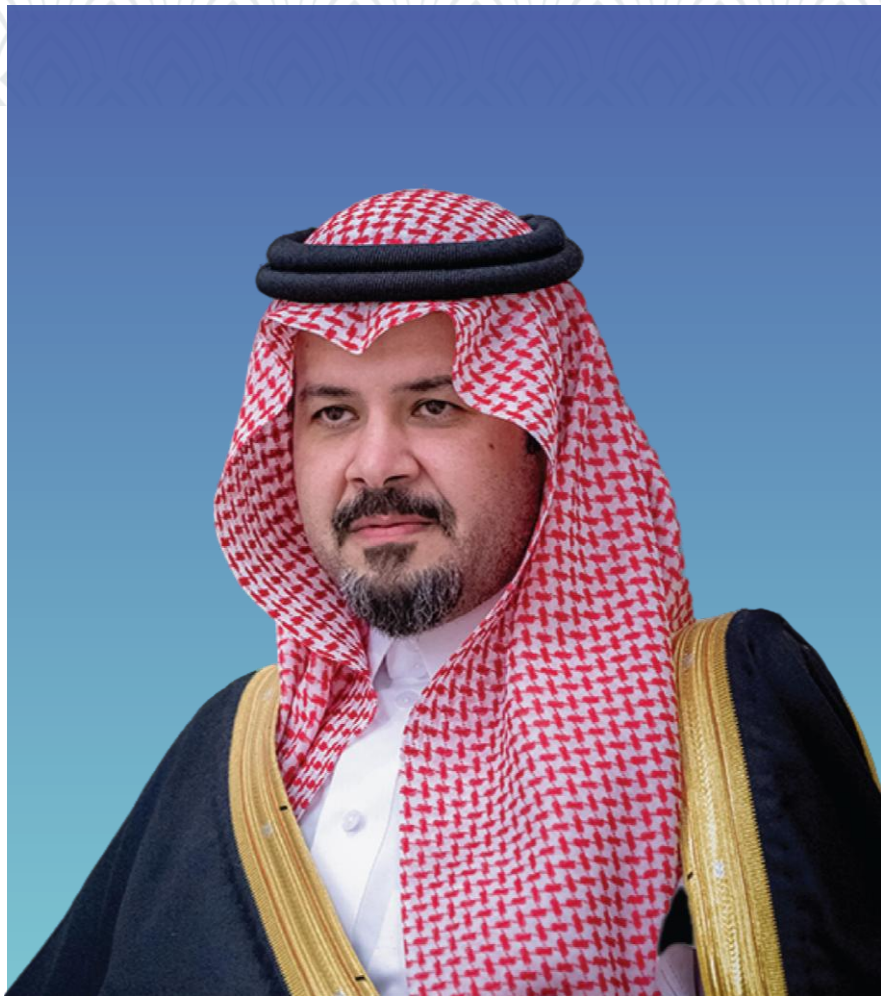
صاحب السمو الملكي الأمير سلمان بن سلطان بن عبد العزيز آل سعود أمير منطقة المدينة المنورة رئيس مجلس الإدارة