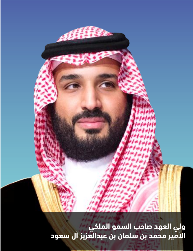
ولي العهد صاحب السمو الملكي الأمير محمد بن سلمان بن عبدالعزيز آل سعود

” نهدف للوصول إلى قطاع غير ربحي مهم مبادر وداعم ومؤثر في التعليم والصحة والثقافة والمجالات البحثية“